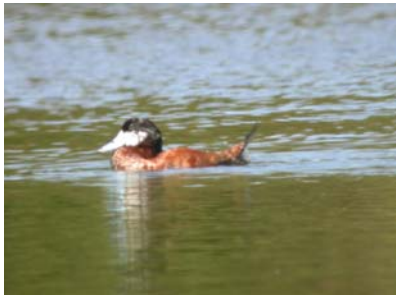
Erismature rousse (mâle nicheur, bec bleu !)