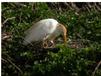
Héron garde bœufs (« pique bœufs ») bec plus fort jaune, orange chez les nicheurs, pattes jaunes