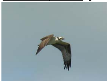
Balbusard pêcheur (grand rapace 1,30 à 1,8m d'envergure)