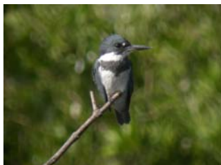
ici un mâle