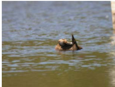
Erismature routoutou (femelle)