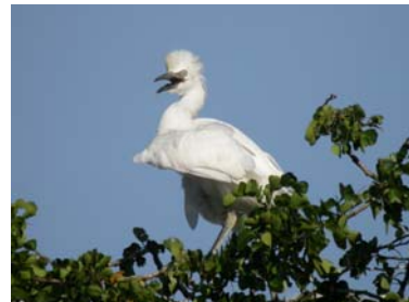
juvénile : bec gris noir