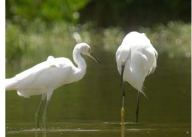
G : une immature (dos des pattes verdâtre)