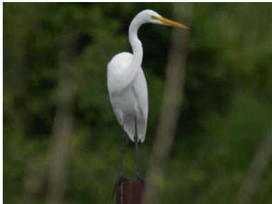
La Grande Aigrette (grde taille, bec jaune, pattes et pieds noirs)