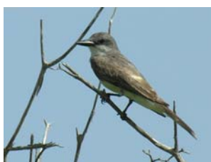
Tyran gris (« pipirit »)