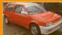
Voiture Citroën 2008