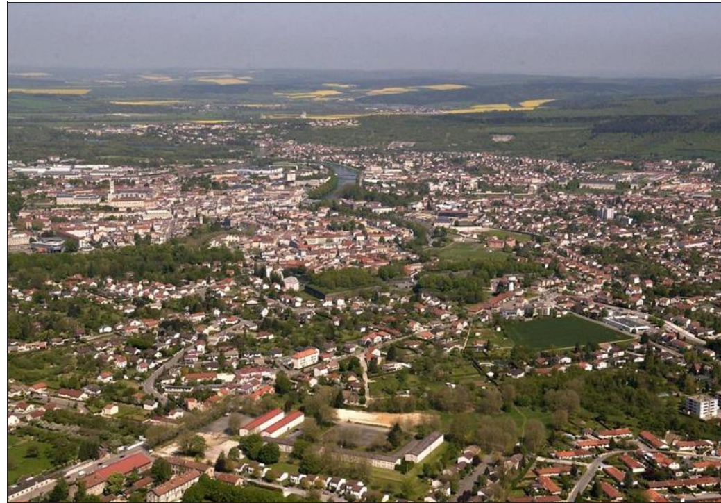
■ L'intercommunalité regroupera-t-elle à terme 51 communes ?

Depuis des mois, cette perspective n'enchantait guère les élus mais ils y pensent, cherchant le moyen de faire contre