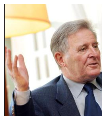
■ Arsène Lux, maire de Verdun.