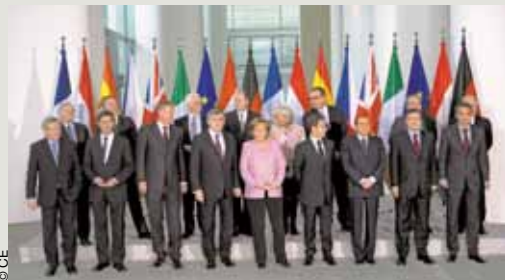
Une réunion préparatoire au G20 s'est tenue le 22 février dernier à Berlin.

Un sommet exceptionnel du G20 doit se tenir à Londres le 2 avril pour permettre aux pays développés et émergents de se pencher ensemble sur la crise économique et financière. Les membres du G20 (dont quatre pays européens : Allemagne, France, Italie et Royaume-Uni) représentent les deux tiers de la population mondiale et les neuf dixièmes de la production économique. La Commission européenne souhaite que des décisions concrètes soient adoptées, notamment en matière de lutte contre les paradis fiscaux et de régulation des fonds spéculatifs. Le 4 mars, la Commission européenne avait présenté une communication, L'Europe au cœur de la relance, contenant de nombreuses mesures pour rétablir la confiance, assurer la stabilité du système financier, soutenir l'économie réelle et limiter le coût humain de la crise.