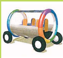
Le tube de Saclay

L'icône : réponse primée au titre de l'image internationale