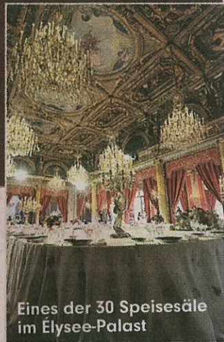
Eines der 30 Speisesäle im Élysée-Palast