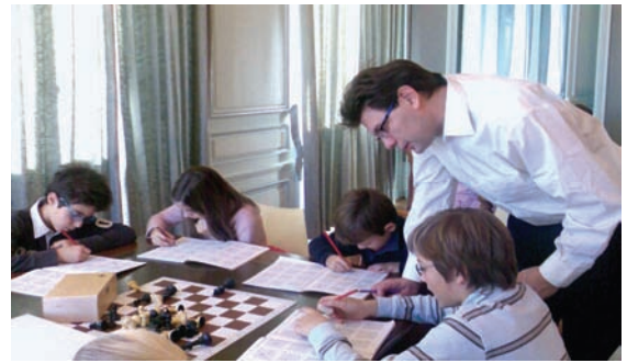
Les enfants concentrés sur leur cahier avec le soutien du Grand-Maître

dispose le professeur d'échecs, le club ou l'école.