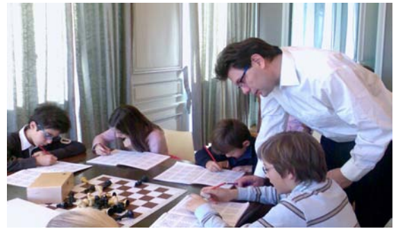
Les enfants concentrés sur leur cahier avec le soutien du Grand-Maître

dispose le professeur d'échecs, le club ou l'école.