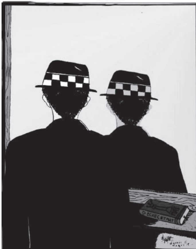
Illustration: Olivier Jaquet d'après Magritte

Dimanche 9 mars CLR Chêne-Bougeries Dimanche 6 Avril MDQ Pâquis