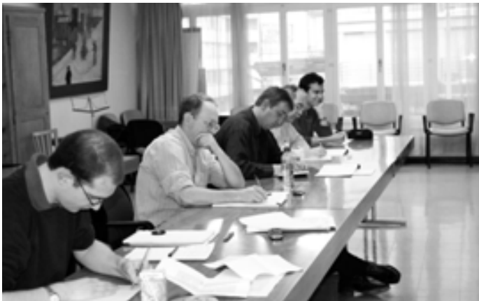
Des aspirants-arbitres zélés et attentifs.