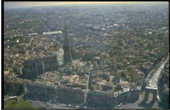
Bordeaux - West Europe Wine Capital

Luând orașul Bordeaux, ca și punct de referință, ne dăm seama că Focșaniul îndeplinește toate pre-condițiile necesare pentru a deveni o versiune minoră o orașului Bordeaux în Estul Europei. Viile din județul Vrancea, capacitatea producției de vin, resursele naturale și de mediu, mediul natural al munților Carpați, etc. toate asigură pre-condițiile necesare.