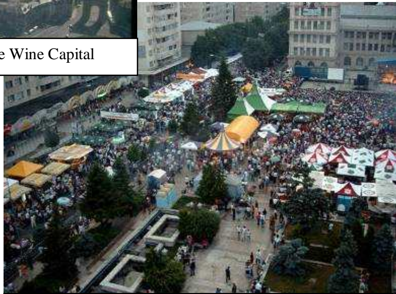
Focsani – East Europe Wine Capital

Am pus următoarele întrebări: Cum putem obține asta? Poate Focșaniul să devină un Bordeaux pe granița Europei de Est? Ce ar trebui să facem în acest sens?