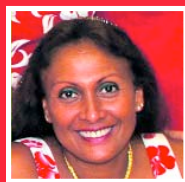
Heifara IZAL AIA API