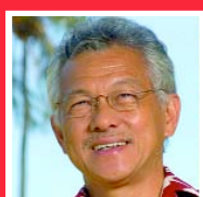
Gaston TONG SANG O PORINETIA TO TATOU AIA