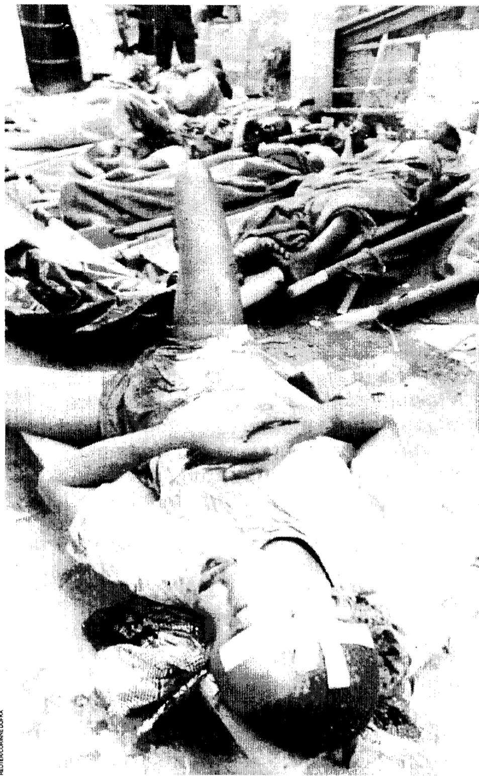
A Kigali, des blessés en attente de soins.

● A LA MUTUALITE LE 27 JUIN. Le Parti communiste organise le lundi 27 juin une soirée de solidarité avec le Rwanda à la Mutualité, pour l'arrêt des massacres, l'aide à une intervention de l'Organisation de l'unité africaine et de l'ONU et à la reconstruction du pays.