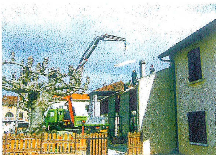
Au foyer, les travaux avancent bon train. Les délais devraient être respectés.