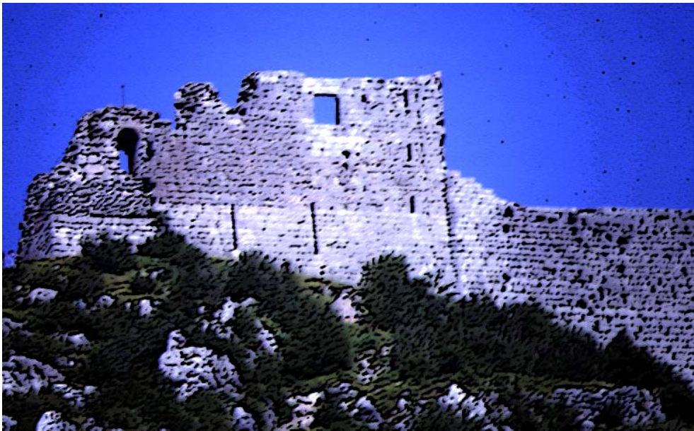
Les ruines du château de Montségur ( Ariège )

sorte qu'en questionnant les familles, en interrogeant les traditions des villages, si on apprenait qu'un prodigieux vieillard avait jadis vécu au-delà de l'âge normal, on pourrait penser que c'était lui qui, il y a trois siècles, avait eu le sang du Christ contre son cœur et en avait reçu la vie physique. A moins qu'il n'ait été consumé par les effluves incandescents sortant de l'émeraude sacrée et qu'il ne fût depuis longtemps qu'un peu de cendre sous la terre.