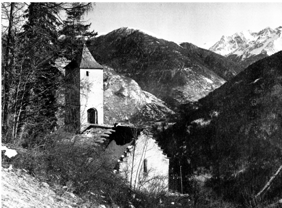
L'Eglise de Cazaril

Alphonse Urraque ! L'homme qui m'avait refusé autrefois l'autorisation d'ensevelir Raymond d'Alfaro. Le dominicain d'Avignonnet qui semblait avoir reçu la tâche mystérieuse de retrouver les liens unissant le présent au passé et permettant de savoir comment les âmes étaient liées les unes aux autres ! La plus terrible des tâches, celle qui empêchait la haine de mourir !