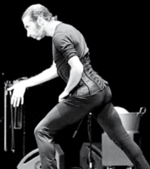
Israel Galván © Hugo Gumiel