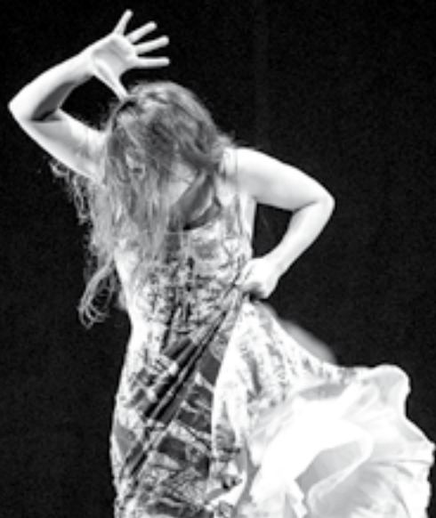
Rocío Molina © Alain Sherer