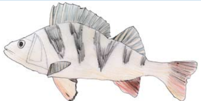
illustration : Jordan

La Perche commune Perca fluviatilis Percidés 3/4 kg - 50 cm 20 ans Eurasie - zébrée de noir - nageoire du dos épineuse - vit en groupe