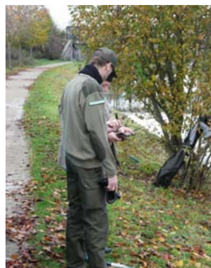
Pour le pêcheur en règle, le contrôle de la carte de pêche est une simple formalité.