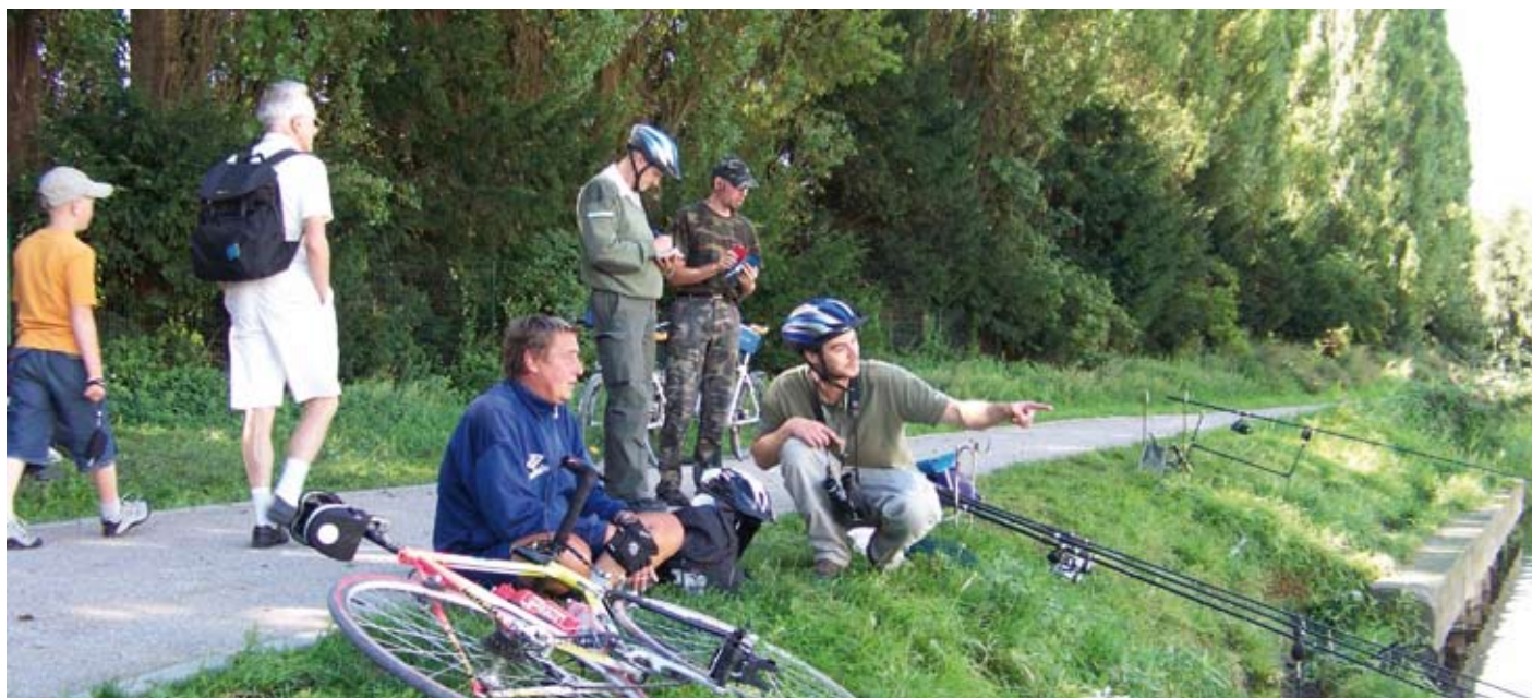
Un garde pêche et un médiateur, duo qui veille à la bonne cohabitation des différents usagers du canal.