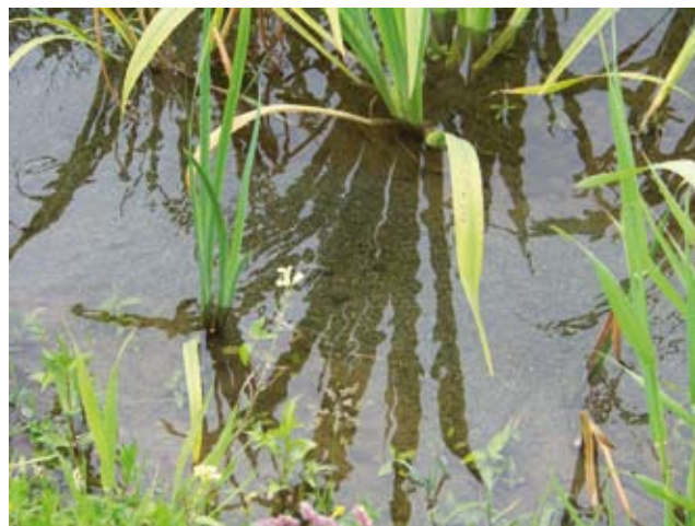
L'eau, une richesse à préserver

Le deuxième axe de collaboration portera sur les analyses d'eau. L'eau du robinet est le produit alimentaire le plus contrôlé. Les Eaux du Nord souhaitent mettre leur expertise au service des brigades vertes du syndicat, qui par leur présence sur le terrain, ont cette capacité à détecter rapidement un problème de pollution des canaux. Les membres du laboratoire Eaux du Nord les formeront aux techniques de prélèvements et d'analyse. Formation, mais également soutien matériel puisque les Eaux du Nord financeront du matériel pour assurer les prélèvements et analyses de l'eau. C'est toute notre capacité de mobilisation et notre sens du partenariat que nous devons mettre au service de l'eau et de sa préservation.