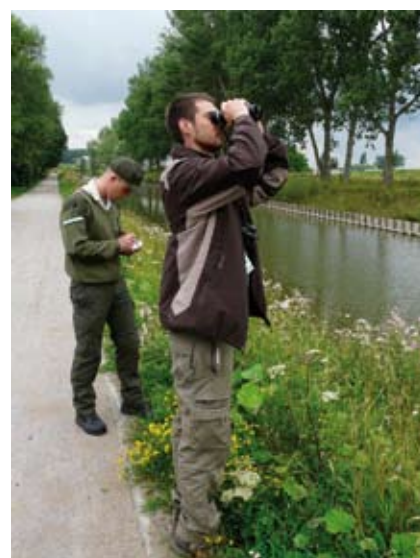
Les agents sur le terrain sont « les yeux » de nombreux services qui travaillent autour du canal