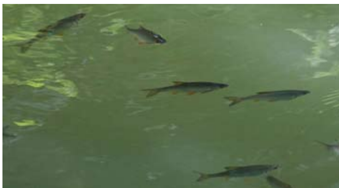
Malgré le manque de végétation favorisant la reproduction, le canal est très poissonneux