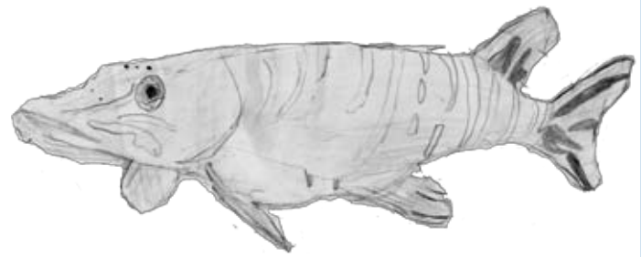
illustration : Mathys

Le Brochet Esox lucius Esocidés 19/20 kg - 1,50/1,70 m 15 ans pour les mâles et 20 ans pour les femelles Europe, Etats-Unis et Canada - 700 dents en moyenne - nageoire du dos très reculée