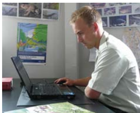
Sur le terrain et au bureau, l'association est dotée d'outils performants pour la préservation de la faune et de la flore des milieux aquatiques.