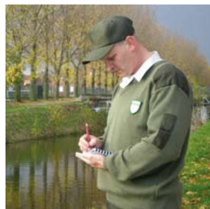
Les constats permettent la rédaction de rapports et le suivi des problèmes

Etudes, aménagements, dossiers techniques en vue de demandes de subventions par exemple, ..., sont autant de tâches que ce pôle réalise quotidiennement en complémentarité avec la Brigade Verte qui lui sert de relais pour toutes les informations relevées sur le terrain et qui peuvent alimenter tous les documents produits.