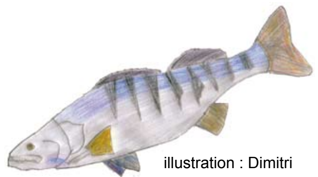
illustration : Dimitri

Le Sandre Stizostedion lucioperca Percidés 15/16 kg - 1,20/1,30 m 20 ans Europe Centrale - 4 canines très développées - n'aime pas la lumière - nageoire du dos en 2 parties