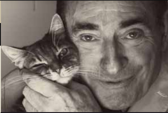
RENCONTRE À 20h30 AU BISTROT