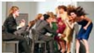
ALL LES RÊVES DANSANTS, SUR LES PAS DE PINA BAUSCH [Tanzträume]