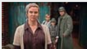
ALL MARGA [Unter Bauern - Retter in der Nacht]

LUN 15 → 9 h (P) gr., MER 17 → 14 h (P) gr., VEN 19 → 14 h (P) gr., SAM 20 → 16 h 30 (P) et 21 h (V), DIM 21 → 14 h 30 (P).