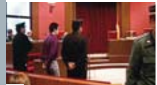
ESP EL PERDÓN inédit

Les festivals de cinéma d'Ardèche, Les Rencontres des Cinémas d'Europe d'Aubenas et le Festival international du Premier Film d'Annonay , se confient mutuellement une carte blanche issue de leur programmation. Cette année, nos amis d'Annonay vous présentent un réalisateur espagnol, Ventura Durall, au travers d'un documentaire et d'un film, Les deux vies d'Andrés Rabadán qui a obtenu le Prix du public au Festival d'Annonay 2010.