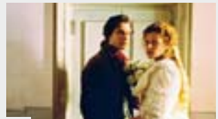
ESP DON GIOVANNI, NAISSANCE D'UN OPÉRA [Lo Don Giovanni]

LUN 15 → 20 h 15 (P), JEU 18 → 8 h 45 (P) gr. et 13 h 30 (P) gr., SAM 20 → 10 h 30 (P).