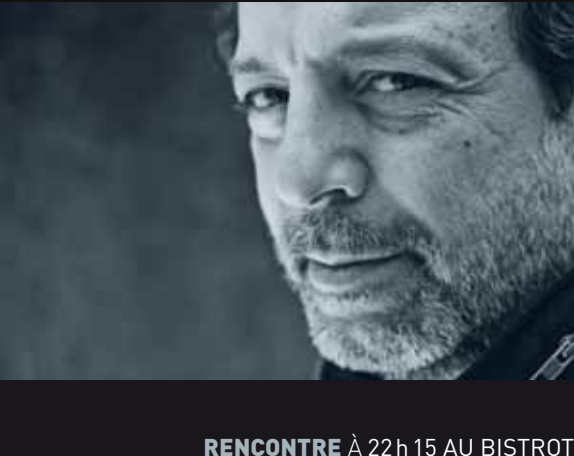
RENCONTRE À 22h 15 AU BISTROT

DIM 14 → 14h (P), MAR 16 → 17h30 (P), SAM 20 → 11h (P).