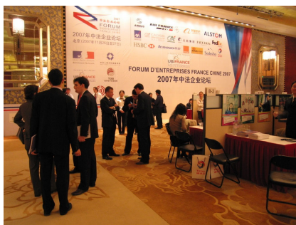
De nombreux échanges entre les rendez-vous