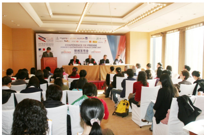
Conférence de presse devant un parterre de journalistes chinois

commerce extérieur : l'ACFCI, la CGPME, la COFACE, le CNCCE, PARTENARIAT FRANCE, OSEO/Anvar, l'UCCIFE, le Comité France Chine et la Chambre de Commerce et d'Industrie française en Chine (CCIFC). L'agence a signé des conventions avec plusieurs organismes consulaires et régionaux. Parmi ceux-ci, il convient de citer : la CCIP (8 entreprises), la CCI de Poitou Charente (10), la CCI Internationale du Doubs (5), la CRCI des pays de la Loire (12), la CCI de Strasbourg et du Bas Rhin (1), l'ADETEM (18), la Mairie de Montreuil (1), Croissance Plus (5) ainsi que la Fédération française de prêt-à-porter féminin (4), le pôle de compétitivité Aerospace Valley (8) et SR21-Société d'économie mixte de la Réunion (4).