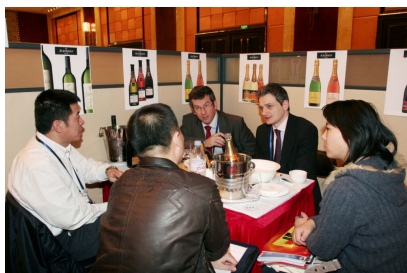
3.800 rendez-vous en B to B sur 2 jours

Ils ont, depuis leur création, démontré leur efficacité à entraîner de nouvelles entreprises françaises sur tous les continents et à les aider à prospecter sur les marchés à fort potentiel. C'est cet objectif premier qui a dicté la conduite du Forum Chine : aider les chefs d'entreprises français à trouver de nouveaux partenariats commerciaux, stratégiques, financiers ou technologiques.