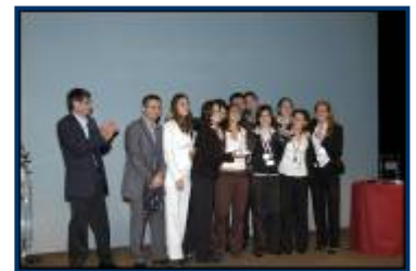
Equipe SIFE Audencia Nantes