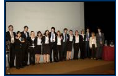
Equipe SIFE ESCE