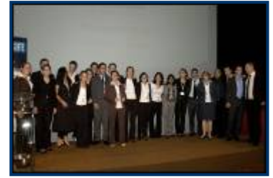
Equipe SIFE EDC

Pour plus d'information rendez-vous sur www.sifefrance.org