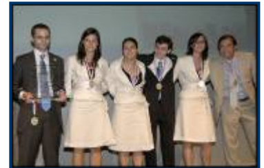
Equipe SIFE ESSEC