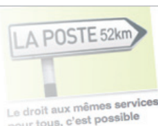
Le droit aux mêmes services pour tous, c'est possible