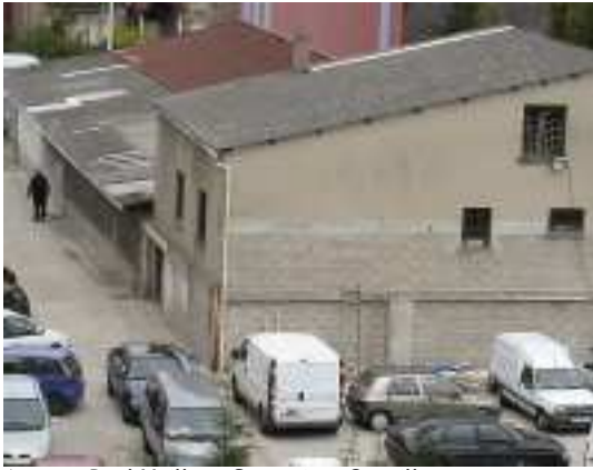
Avenue Paul Vaillant Couturier, Gentilly