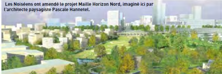
Les Noiséens ont amendé le projet Maille Horizon Nord, imaginé ici par l'architecte paysagiste Pascale Hannetel.

économique, habitat, espaces publics, équipements : chaque dimension du projet a été débattue. Si vous n'étiez pas aux ateliers, il n'est pas trop tard : un registre est à votre disposition à l'hôtel de ville, au pôle Urbanisme & Cadre de vie ! ■