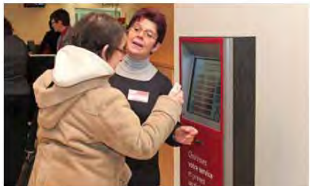
Les bornes de gestion de flux délivrent des tickets correspondant à vos démarches.

grenat, situées aux deux extrémités du comptoir. Grâce à leur écran tactile, vous trouverez facilement votre démarche. Il vous suffit de la sélectionner. La borne vous délivrera alors un ticket sur lequel figure un numéro d'appel et l'endroit où vous devez vous rendre. Les écrans d'affichage situés dans les pôles thématiques annoncent l'ordre de passage. Au final, ce système permet d'améliorer considérablement