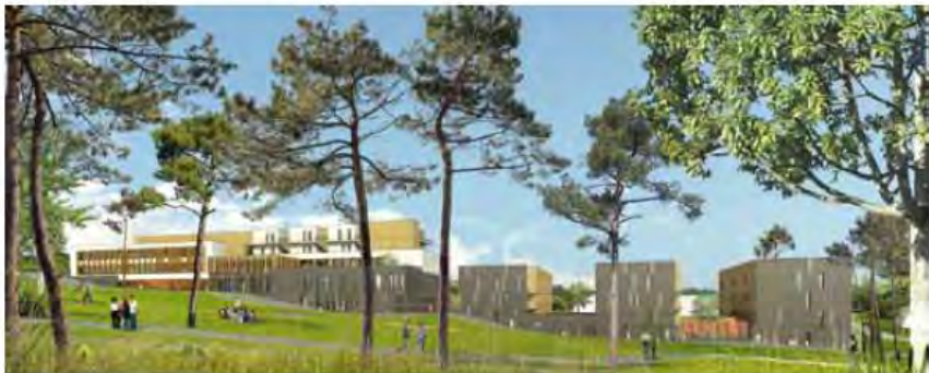
Le 25 février prochain, un projet de nouveau parc urbain sera proposé aux Noiséens.

Au-delà des plaisirs bucoliques, la création de ce parc s'accompagnerait d'une requalification de la voirie environnante afin de desservir le