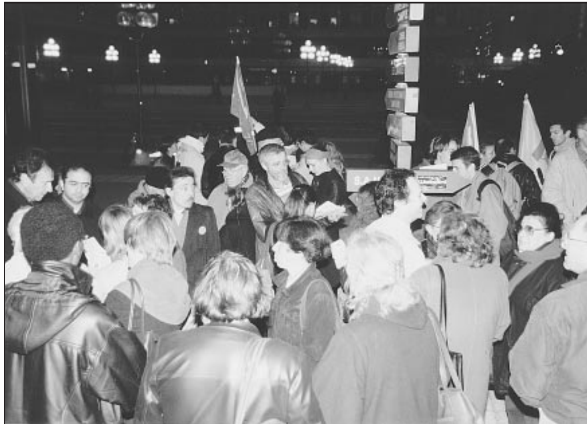
CERGY, DEVANT LA PREFECTURE, HIER. Alors que les inspecteurs en désarmement de l'ONU débutaient leur mission en Irak, une cinquantaine de manifestants sont venus exprimer leur hostilité à une éventuelle guerre dans ce pays.