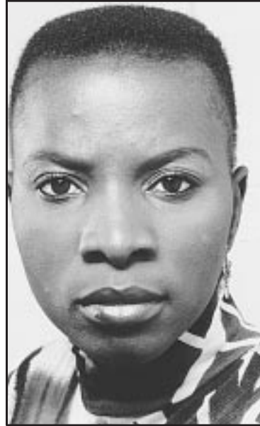
Parmi les cinq concerts prévus ce soir dans le Val-d'Oise figurent Jacques Higelin à Saint-Brice (à gauche), Marc Lavoine à Argenteuil (à droite) et l'artiste béninoise confirmée Angélique Kidjo à Saint-Ouen-l'Aumône.

Marc Lavoine à Argenteuil, tarifs : 20-23 €, tél. 01.34.34.15.76 ; Jacques Higelin à Saint-Brice, tarif : 23 €, tél. 01.39.33.01.80 ; Angélique Kidjo à Saint-Ouen-l'Aumône, tarifs : 5-16 €, tél. 01.34.21.25.70 ; Flying Pooh à Eragny, tarif : 7,75 €, tél. 01.34.48.35.75, festival Furia à Pontoise, tarif : 10 €, tél. 01.34.20.02.02.