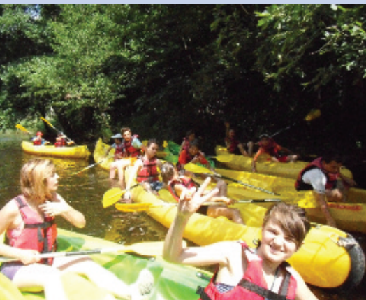
Les Grands et Ados (11/15 ans) à Menat « Ça bouchonne sur la Sioule »

Quand les enfants et les jeunes du centre de loisirs partent en camping, ce n'est pas uniquement pour le dépaysement et la pratique d'activités ludiques.