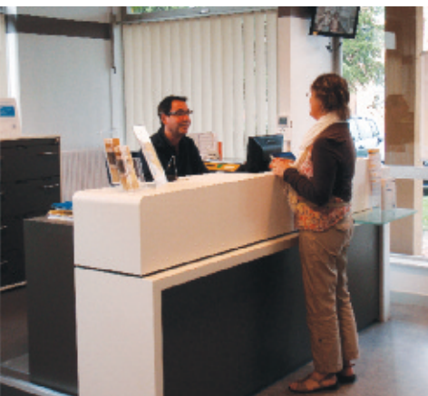
Texte et photos fournis par le service communication de la Poste

Après 7 semaines de travaux, la Poste de Désertines a rouvert ses portes à la clientèle le 23 juillet dernier.