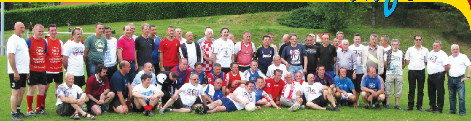
L'Union Sportive Biachette a 50 ans