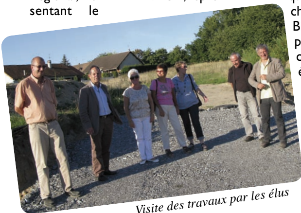
Visite des travaux par les élus

Sans régler tous les problèmes, de nombreuses familles de notre agglomération et plus généralement de l'ouest du département de l'Allier, seront soulagées de disposer, à proximité de leur domicile, d'un lieu moderne et adapté pour accueillir nos anciens.