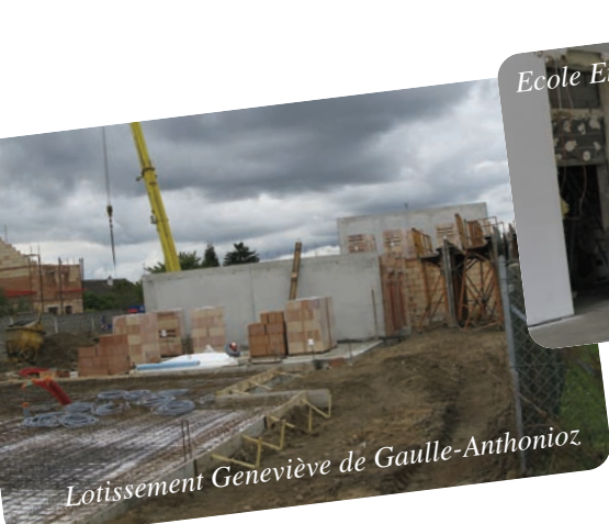
Lotissement Geneviève de Gaulle-Anthonioz