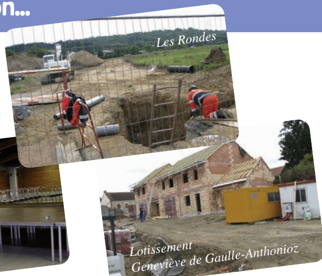
Lotissement Geneviève de Gaulle-Anthonioz