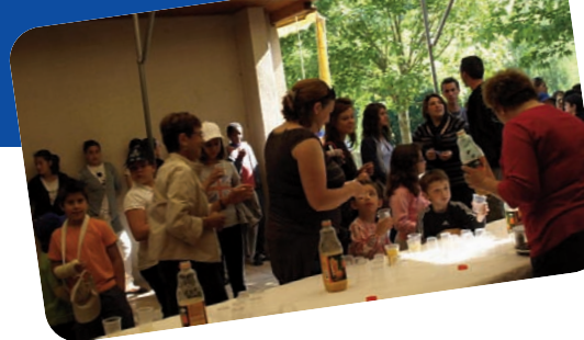
4 : vendredi 6 mai bienvenue autour d'une collation aux enfants des centres de Montluçon, Domérat et Désertines.

A la date de la création de cet article, il reste encore quelques places pour le mois d'août.