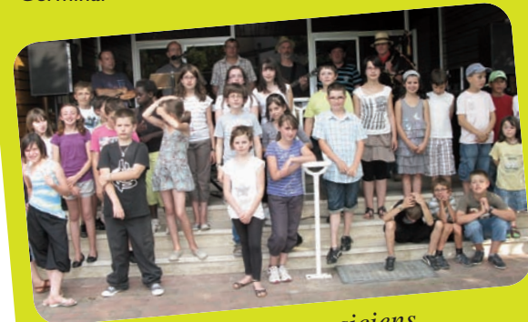
Petits chanteurs et musiciens

Marché de Noël le Vendredi 02 Décembre à Germinal