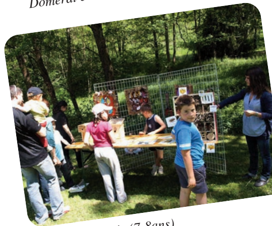
5. Stand des petits(7-8ans) de Désertines qui présentent leur hôtel à insectes.