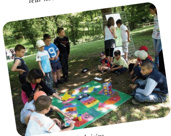
6. le centre de loisirs d'Henri Wallon propose leur jeu de l'oie qui traite du recyclage.