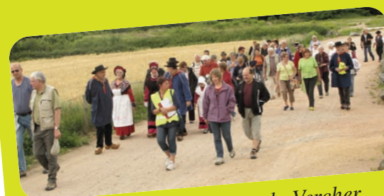
Balade contée au départ du Vercher