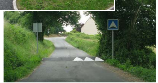
Rue de la Fontaine