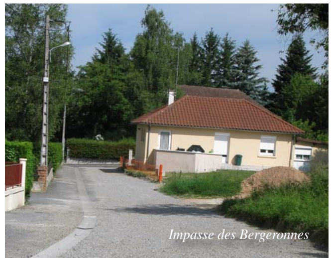
Impasse des Bergeronnes