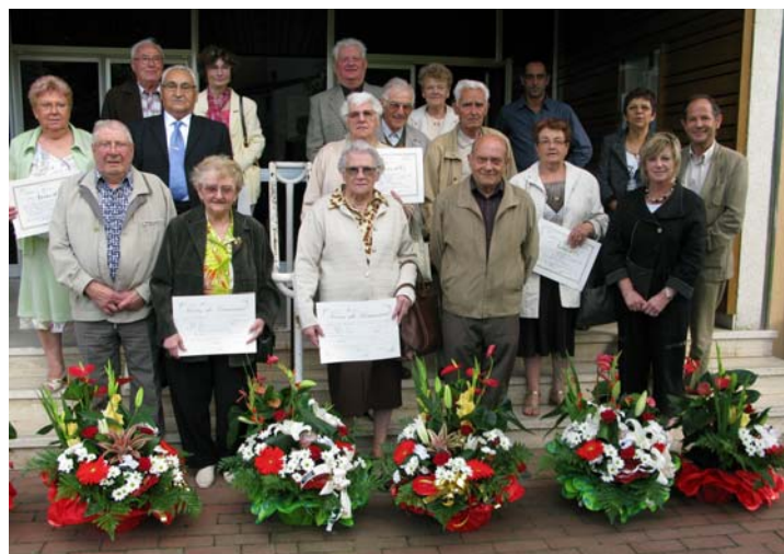
7 couples biachets viennent de fêter leurs noces d'or et de diamant traduisant 50 et 60 ans de mariage