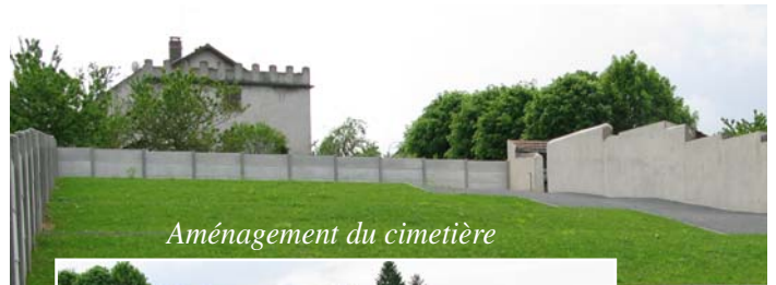
Aménagement du cimetière

Vous avez donc entre les mains, un Désertines Info bien copieux et en attendant la rentrée de Septembre, je me permets de vous souhaiter à toutes et à tous, un bon été.