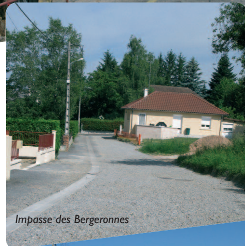
Impasse des Bergeronnes