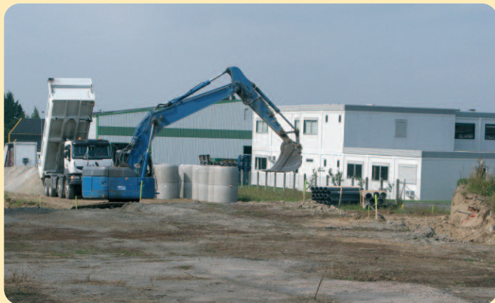
Lotissement Elsa Triolet

Le projet de Montluçon Habitat (dix pavillons) prend forme. Celui-ci a été présenté aux habitants du quartier, en présence du comité de quartier.