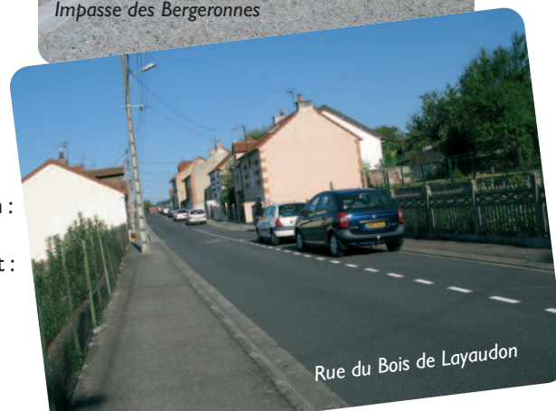
Rue du Bois de Layaudon