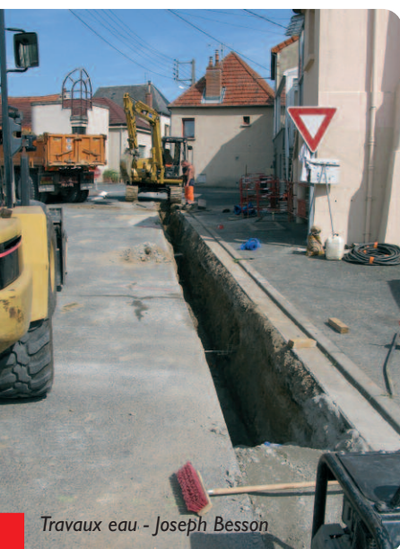
Travaux eau - Joseph Besson