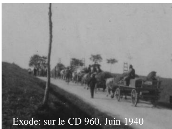
Exode: sur le CD 960. Juin 1940