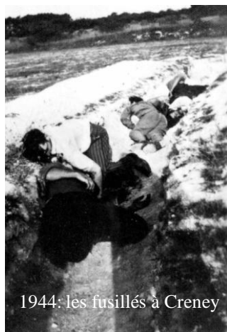
1944: les fusillés à Creney