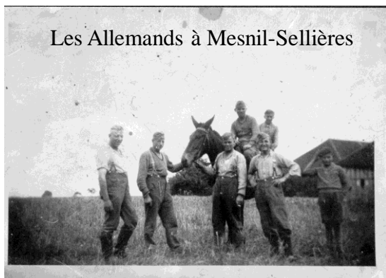
Les Allemands à Mesnil-Sellières