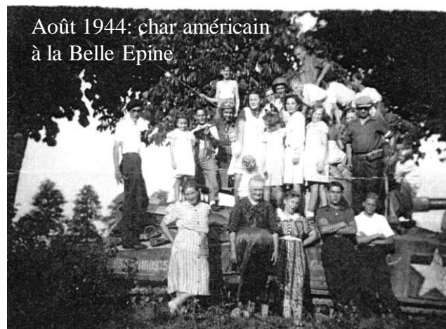
Août 1944: char américain à la Belle Epine