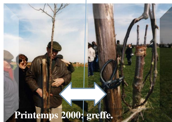
Printemps 2000: greffe.