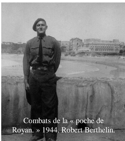
Combats de la « poche de Royan. » 1944. Robert Berthelin.