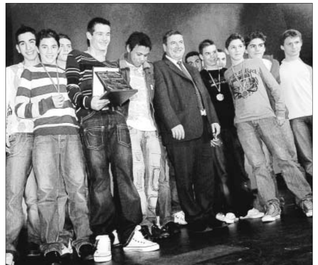
L'équipe des 14 ans fédéraux du SOC a terminé à la première place du championnat fédéral. Ils ont eu droit aux honneurs du public de l'Angelarde hier soir.