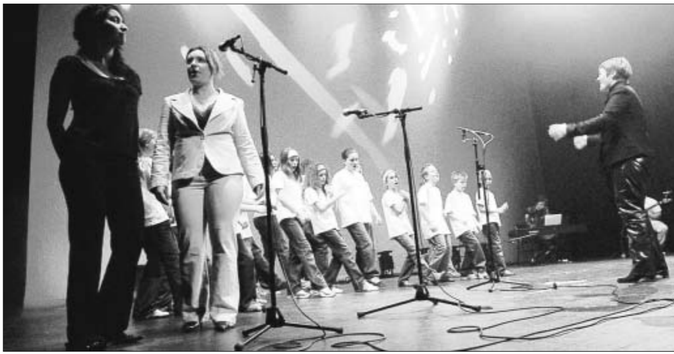
La soirée était cette année émaillée d'animations diverses : les petits chanteurs et chanteuses de l'association « Attrape Lune » ont donné un aperçu du spectacle qu'ils présenteront dans la salle de l'Angelarde au mois de juin prochain.