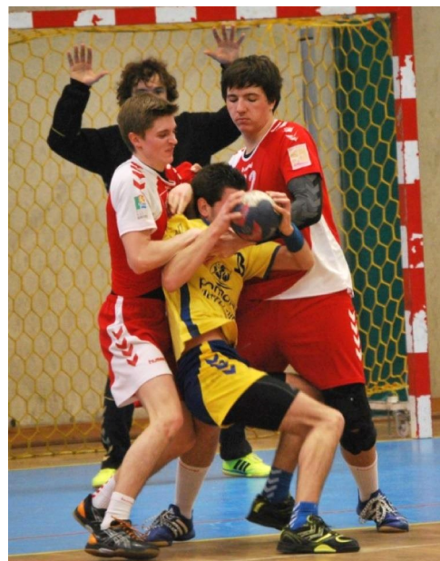
Les 18 garçons

Les seniors filles qui n'ont pas joué depuis bien longtemps se rendront à Bolbec. Les Bolbécaises sont largement devant au classement. Elles ont les faveurs du pronostic. Mais les stadistes au complet peuvent inverser la tendance.