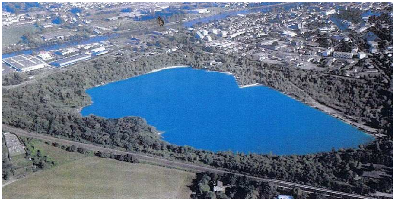
Lac de Beaumont-sur-Oise Le plus grand lac profond de la région Ile-de-France Photo aérienne 2004

Ce lac, d'une eau cristalline, est alimenté par la nappe d'eau potable de la craie. Il est sous l'influence de l'Oise située à 400 m et joue un rôle protecteur et utile en cas d'inondations en absorbant une quantité importante des crues. Une partie du site est d'ailleurs déjà classée en Zone Naturelle d'Intérêt Ecologique Faunistique et Floristique (ZNIEFF).