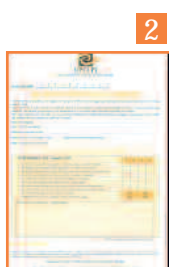
2 Fiche d'évaluation