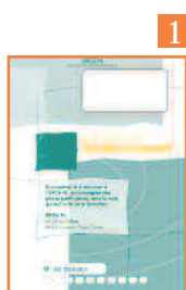
1 Demande de remboursement

Si les frais pédagogiques sont réglés par l'OPCA PL à l'organisme de formation, vous devez retourner les documents 1 et 2