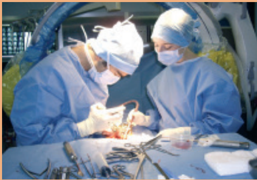
▲ pôle chirurgie