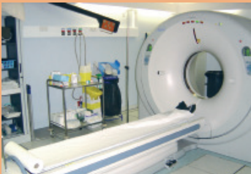
▲ scanner 64 barrettes