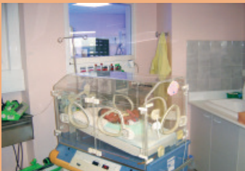
▲ pôle femme-enfant : néonatalité