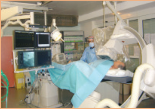
▲ pôle cardiologie