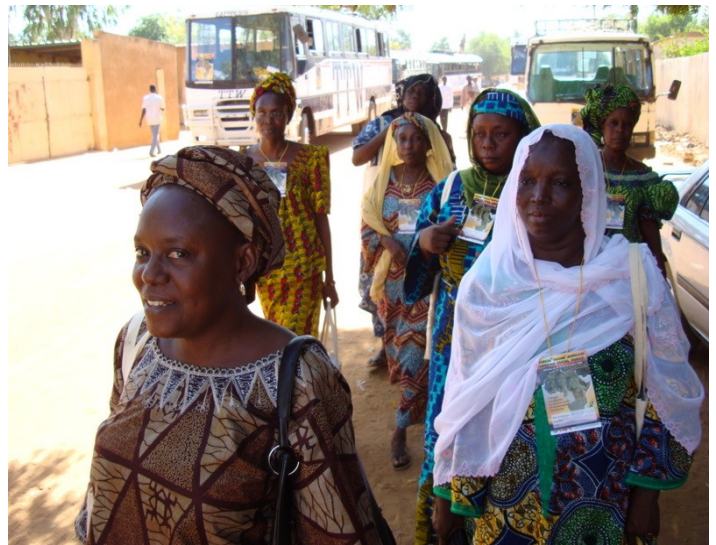
Participant-e-s au Forum social africain de 2008 à Niamey au Niger. Zoulstory.com

expériences afin de développer des méthodes ou théories « alternatives » capables de changer les rapports de forces politiques et de construire un développement pensé et exécuté par les Africains et pour les Africains. Forum social africain, forum des Peuples (contre-point africain au G8), forum africain des alternatives, forum du Tiers Monde, réseau Jubilé Sud, CADTM (annulation de la dette) ou mouvements citoyens,... : la liste des mobilisations traverse tout le continent. Abordant des sujets aussi variés que la condition des paysans, la souveraineté alimentaire, les libertés politiques, le rôle des nouvelles technologies dans le développement des luttes ou le poids de la guerre, les militant-e-s passent de la conscience à l'action, s'auto-organisent et cherchent à valoriser les dynamiques endogènes des différents tissus sociaux locaux.