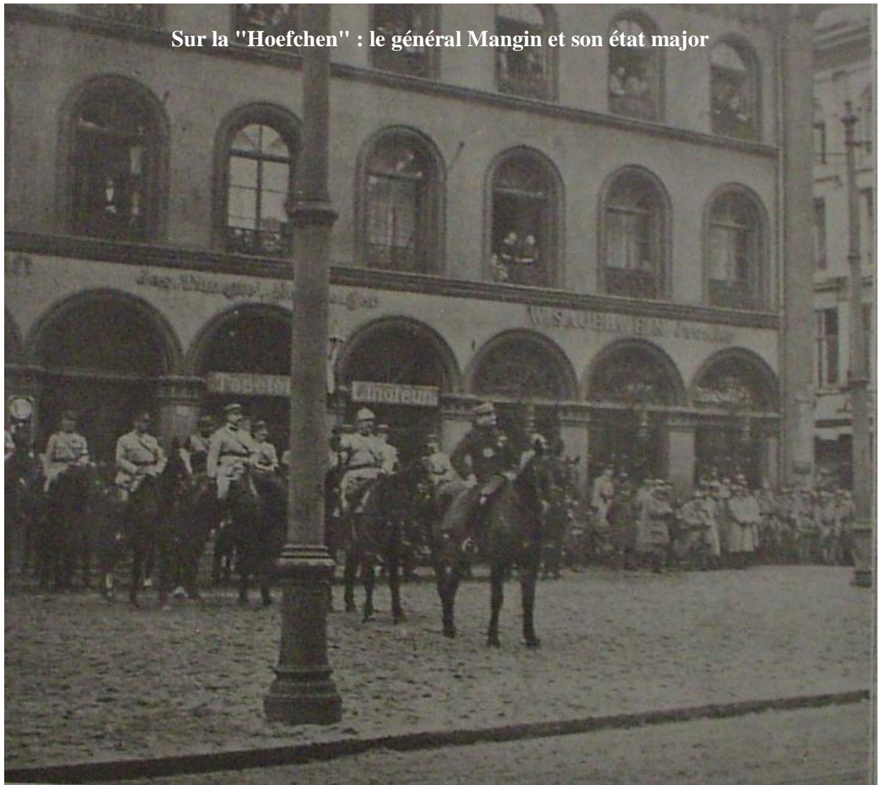
Sur la "Hoefchen" : le général Mangin et son état major