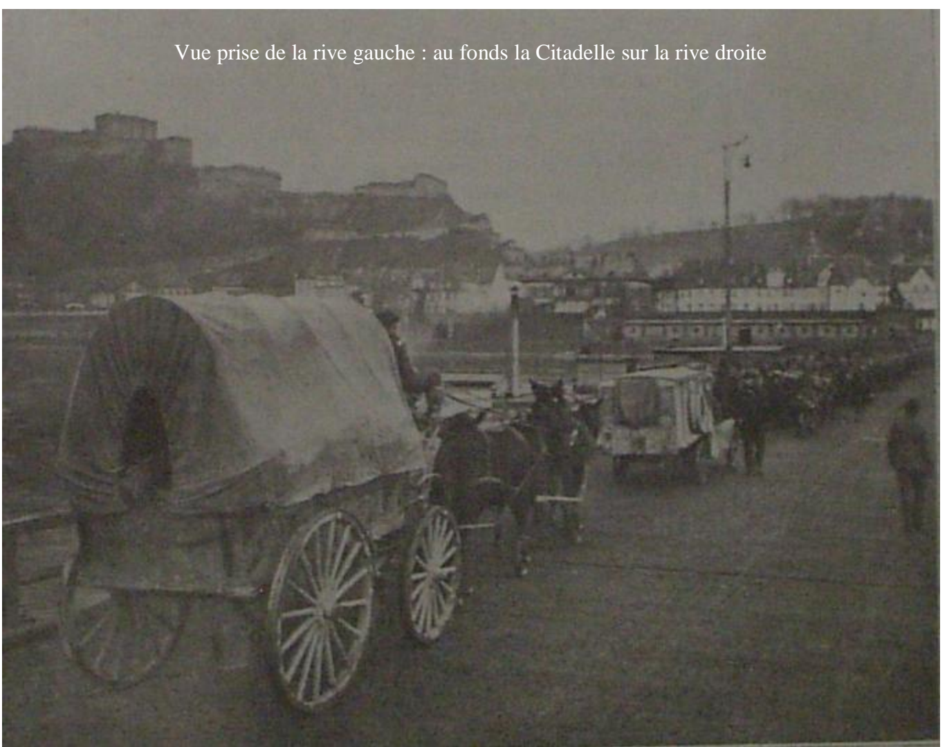
Vue prise de la rive gauche : au fonds la Citadelle sur la rive droite