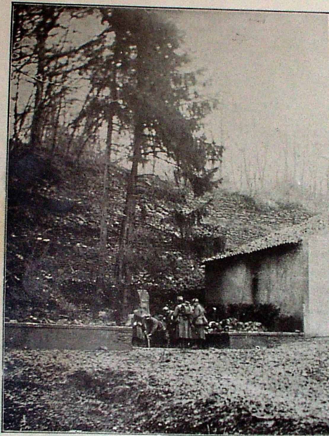
La fontaine du Père Horion où, pendant un mois, Français et Allemands venaient puiser de l'eau, sortant sans armes de leurs tranchées, par une entente tacite; aujourd'hui, nos troupiers y font librement leurs ablutions.