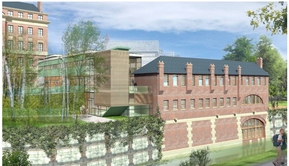
VUE DEPUIS LA RUE DES PETITES EAUX DE ROBEC

Chantier de l'Auberge de jeunesse Maison de maître de la teinturerie Auvray 247-251, route de Darnétal Accès : TEOR T2 ou T3 • arrêt "Auberge de jeunesse"