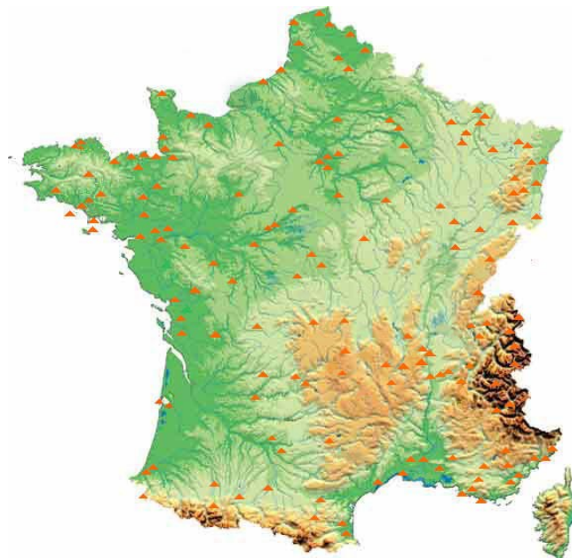
La carte des auberges de jeunesse en France

L'auberge de jeunesse de Rouen viendra compléter l'offre dans la partie nord-ouest de la France : il n'y a pour le moment pas d'équipement de cette nature entre Paris et Dieppe.