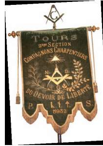
Bannière des Compagnons charpentiers du Devoir de Liberté de Tours