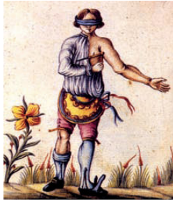
Aquarelle vers 1775 (Mutus liber Latomorum, in "Franc-Maçonnerie, Avenir d'une tradition