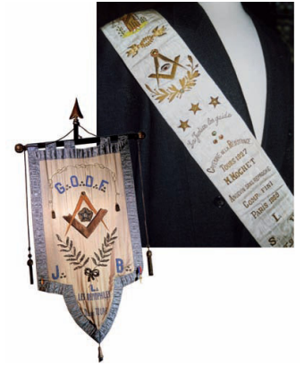
Echarpe ou couleur de Compagnon et bannière de la Loge maçonnique "Les Démophiles" de Tours