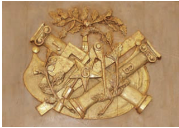
Décor maçonnique en bois doré