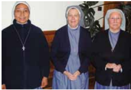
Les sœurs d'Embrun.

Les sœurs trinitaires d'Embrun font partie de la mémoire d'Embrun puisqu'elles sont présentes depuis