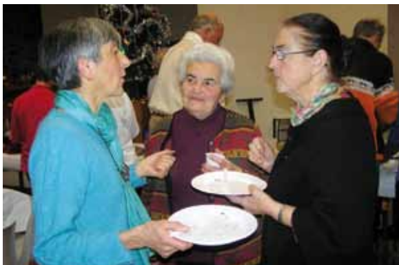
...et repas dans la salle polyvalente d'Éyguians.

Depuis quelques années, aux alentours de l'Épiphanie, les équipes Chrétiens dans le monde rural (CMR) du diocèse de Gap et d'Embrun se retrouvent pour une soirée de réflexion, de célébration de l'eucharistie, et d'un repas tiré des sacs. Le samedi 8 janvier, venus du Gapençais, du Veynois, du Serrois et du Laragnais, et réunis dans la salle polyvalente d'Éyguians, les invités ont échangé sur les dynamiques du baptême dans la vie du chrétien à partir d'un récit de l'Évangile, célébré l'eucharistie et partagé le repas fraternel des retrouvailles et des vœux pour l'année 2011. Sur la page d'entrée du site Internet du CMR ces quelques mots: « Créateurs d'une autre humanité et passeurs d'es-pérance. » www.cmr.cef.fr