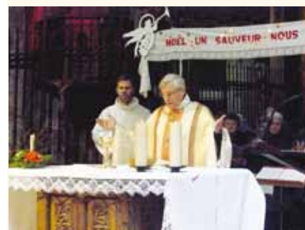
Pendant la messe.