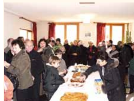
Partage de la galette des rois.