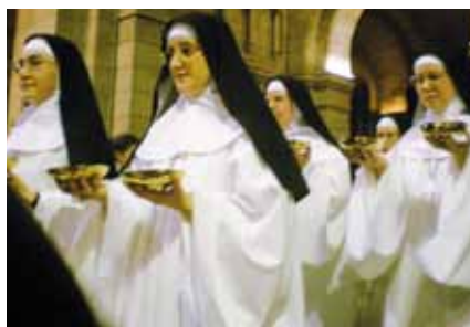
La procession des offrandes par les profès.

Et que dire de la cérémonie ? La basilique pleine à craquer ! Mais régna un seul et même esprit. Impressionnant par la beauté de la liturgie solennelle. Le cœur de chacun a été touché par les paroles