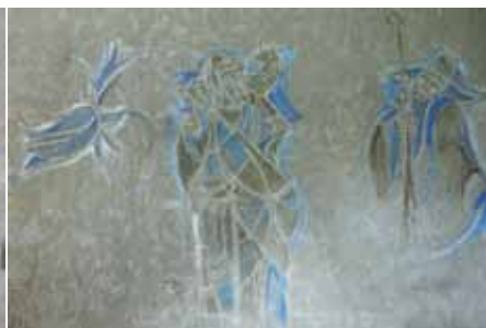
Le Bon Pasteur de l'Évangile selon saint Jean.