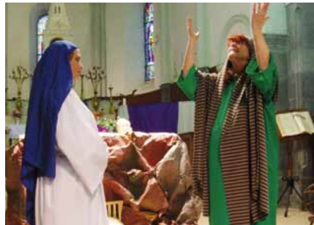
À Saint-Laurent-du-Cros. La Visitation. Marie se rend chez sa cousine Élisabeth.