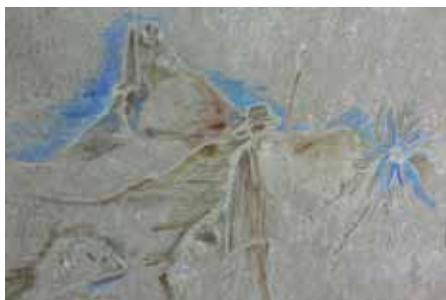
Un berger haut-alpin et son troupeau.

Responsable de la commission diocésaine d'Art sacré