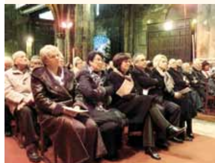
L'assemblée et les élus.

Comme chaque année, la solennité de l'Épiphanie a rassemblé à Embrun l'ensemble des paroisses de l'Embrunais et du Savinois ainsi que des fidèles d'autres régions du diocèse. La messe était célébrée en ce dimanche 2 janvier 2011 par Mgr Jean-Michel di Falco Léandri et suivie d'une galette dans les locaux paroissiaux.