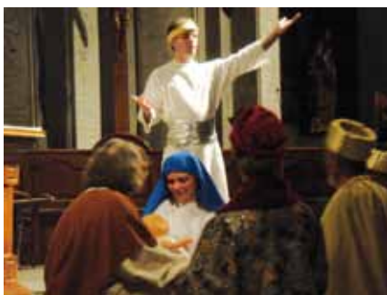
Le 23 décembre à Notre-Dame-du-Laus. L'Épiphanie. L'ange invite les mages à retourner chez eux sans repasser par Jérusalem.