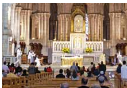
Prière des sœurs bénédictines devant le Saint Sacrement exposé dans la basilique de Montmartre

prononcées pour les professantes. Lors du vin d'honneur, nous avons partagé de plus près avec les sœurs ayant professé et leurs nombreux invités. Et que dire du voyage de retour ? Paris by night : un festin pour nos yeux éblouis ! Surenchéri par les lumières de Noël encore en place. Merci à nos gentils pilotes !