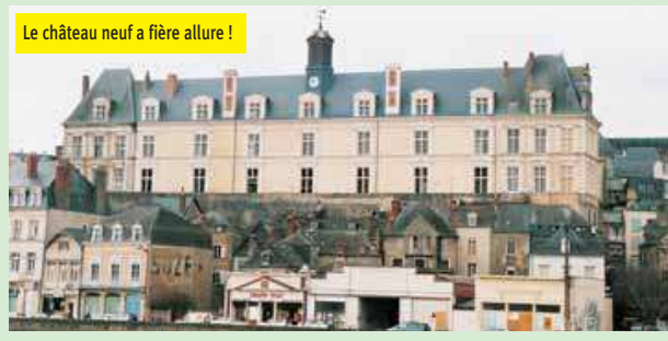
Le château neuf a fière allure !

Quatre grandes expositions rythmeront 2006 : une consacrée à l'archéologie, une dédiée à Géo Ham (le peintre de la vitesse), une à Dermout (un grand de la BD française) et la dernière à la sculpture ( Biennale ).