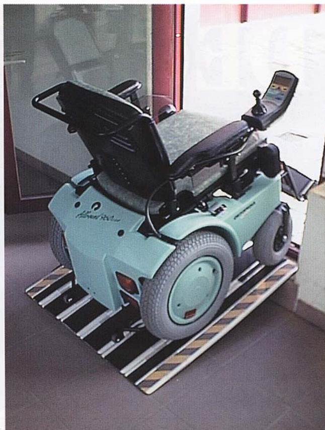
DECPAC PERSONAL et MULTI PURPOSE

Longueur: 700 mm Largeur: 740 mm Poids: 4 kg