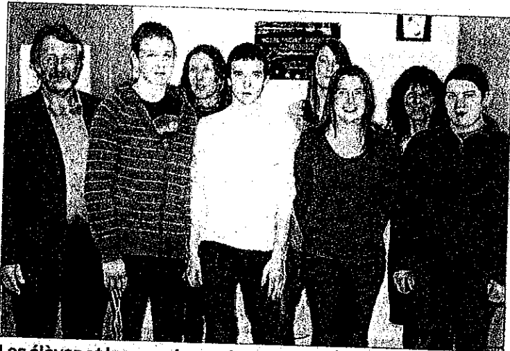
Les élèves et les membres pédagogiques de l'école de Mont vont participer au stage en Italie.

Ce projet pour ces cinq jeunes en 2 e année professionnelle bac pro production animale est financé à 100 % par l'Union européenne. Il a pour but de promouvoir le territoire de chaque pays européen, en valorisant les dimensions rurales et touristique. Il a surtout pour objectif de sensibiliser les étudiants aux différentes techniques d'élevage en Europe et leur faire rencontrer les acteurs du monde professionnel agricole. Car