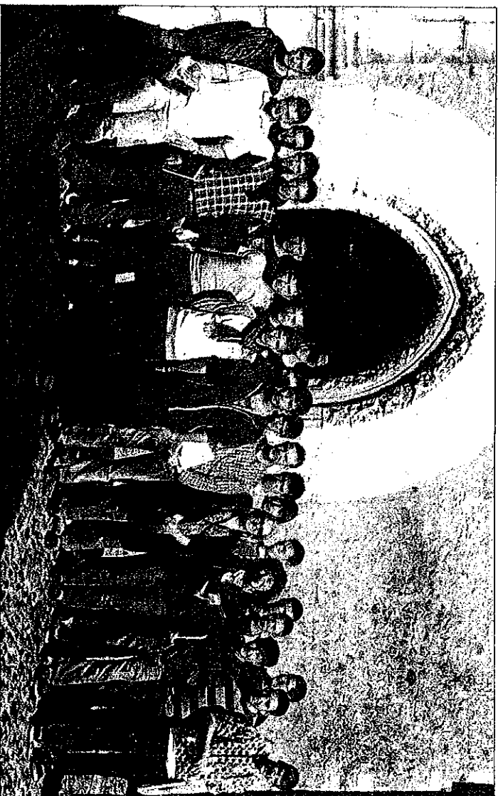
Le groupe d'élèves galiciens et leurs accompagnateurs devant l'église Saint Giron.