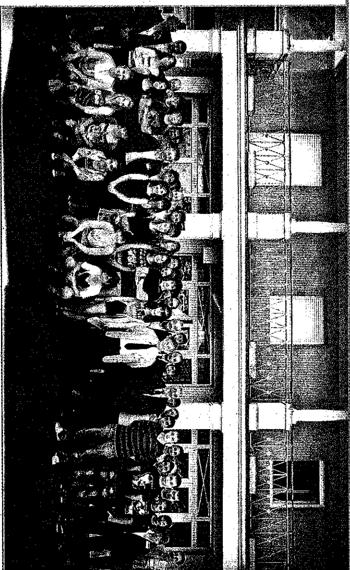
Participant à cette rencontre, des parlementaires européens et des responsables agricoles, lesquels ont présenté une union européenne de l'élevage qui préserve toujours les spécificités de chacun.