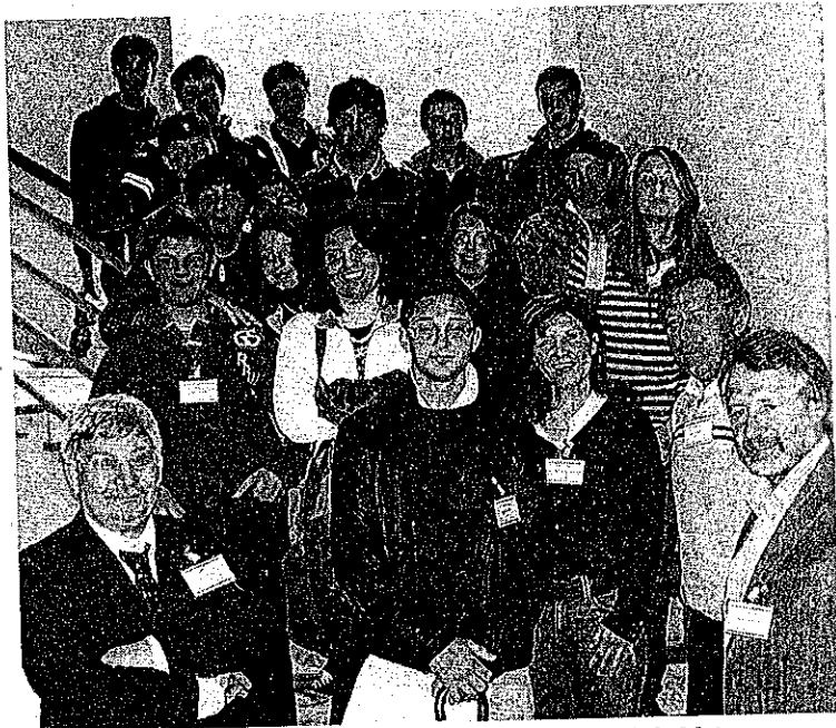
Après leurs séjours en Espagne et en Italie, les jeunes de la Maison familiale rurale reçoivent cette semaine Espagnols et Italiens.

Après la visite en Italie (à l'institut technique agricole Stanga de Crémone) de cinq étudiants de la MFR sur le thème « Races et systèmes d'exploitation », après la visite en Espagne (à l'école familiale agricole Fonteboa) de cinq autres élèves de première bac pro (production animale) sur le thème « Transformation, valorisation et commercialisation des produits issus de l'élevage », c'est la MFR de Mont qui reçoit cette semaine.