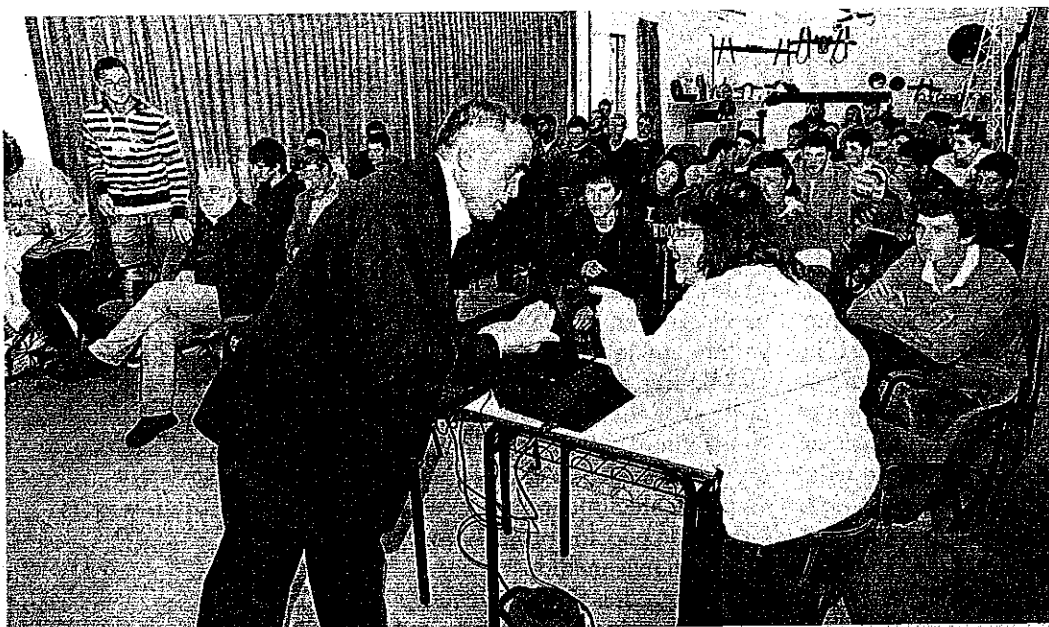
Los alumnos de la EFA Fonteboa de Coristanco comparten estos días experiencias con estudiantes de centros italianos y franceses con los que participan en el programa internacional Comenius