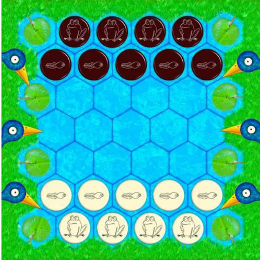
Mise en place du jeu au début de la partie.