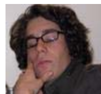
Amaury Relations partenaires et communication