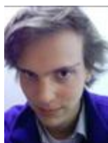
Pierre Relation administration