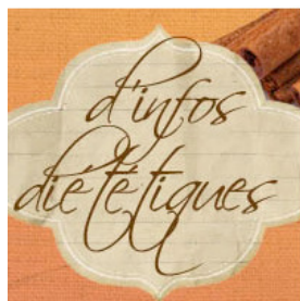
Lauriane Doumayrou (OB) Régime : perdez 15kg en 2 jours ! (02 juillet 2009)