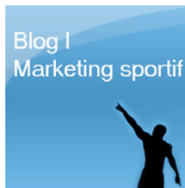
Julien Hermetet Wimbledon dit non à la pub ! (2 juin 2009)