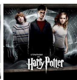
UniversHarryPotter.com (OOB) Harry Potter : L'histoire à succès ! (14 juillet 2009)