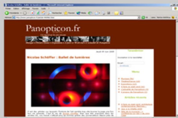
Page d'accueil de Panopticon.fr

Réunir en un lieu unique l'actualité de la création contemporaine , (musique, danse, théâtre, arts plastiques, architecture...) pour partager cette passion : c'est le but de Panopticon.fr.